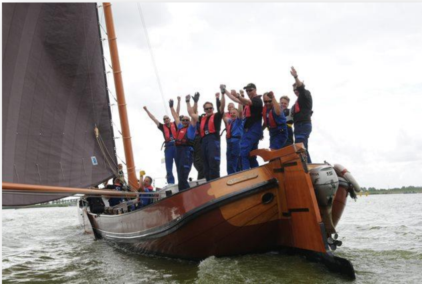
(Ontlading na het binnen halen van de titel)

Op de alles beslissende zaterdag zou de strijd om de titel los barsten tussen Grutte Pier en 't Swarte Wief. Rechtstreekse promotie naar de B-klasse was al een feit geworden, wat een prestatie. Zeilend vanaf een vijfde positie klom 't Swarte Wief rond na ronde een positie. In het aller laatste kruisrak werd leider in de wedstrijd de Oude Zeug en plek terug gewezen. Met wederom een eerste plaats werd de titel binnen gehaald. Een explosie van vreugde volgde bij bemanning, crew, ouders, sponsors, donateurs en uiteraard de vele fans. Wat een feest! Kampioen worden met een compleet nieuw schip in de zwaarste C-klasse sinds jaren.