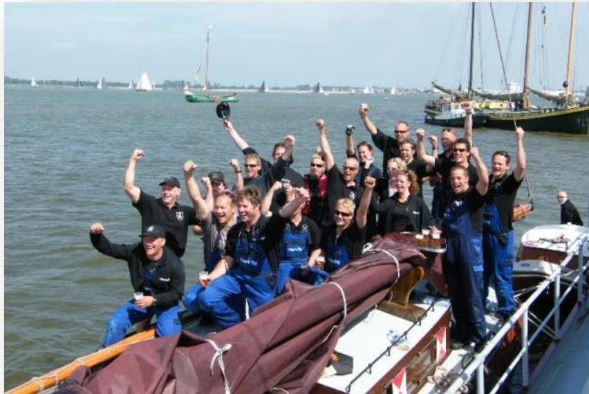
(Kampioen IFKS 2011)

Ook in de laatste drie slotwedstrijden van het jaar liet de bemanning zien dat het IFKS kampioenschap geen toeval was. Want zowel de Friese Hoek Race in Lemmer, de IFKS slotwedstrijd in Heeg en de Roekoepôle Race op het Sneekermeer werden als winnaar afgesloten.