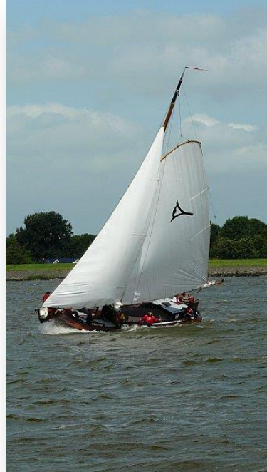
(het kleine skûtsje in 2008 met oud logo)

Vanaf het voorjaar 2008 begonnen de vrienden met de trainingen die ze in enkele maanden tot skûtsjesilers moesten omvormen. De trainingen vonden tweemaal per week plaats en stonden onder leiding van een deskundige beroepszeiler. Langzamerhand wist de kersverse bemanning het schip steeds meer te controleren en tot het uiterste te drijven. Er werd enig gewicht uit de boot gehaald, waardoor het schip al beter presteerde dan voorheen. De bemanning was klaar voor het wedstrijdzeilen.