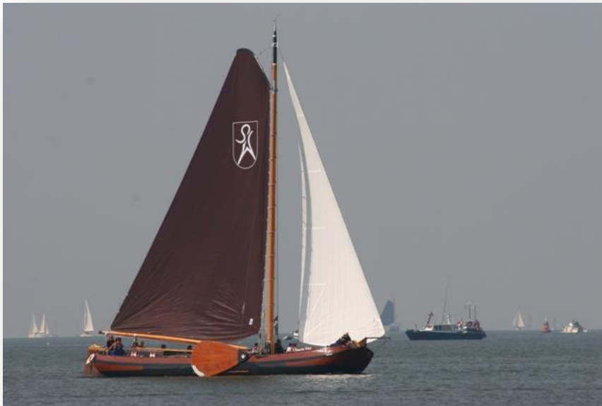
(het compleet vernieuwde skûtsje tijdens IFKS 2010)

Tijdens de IFKS 2010 wisten wij zelfs de top al te benaderen. Met een prachtige tweede plaats op het IJsselmeer bij Stavoren werd onze eerste beker binnengehaald en wisten wij de top te verassen. Vervolgens wisten wij met drie mooie zesde plaatsen en een vijfde plaats op een keurige zesde plaats te eindigen in het klassement. De top was benaderd.