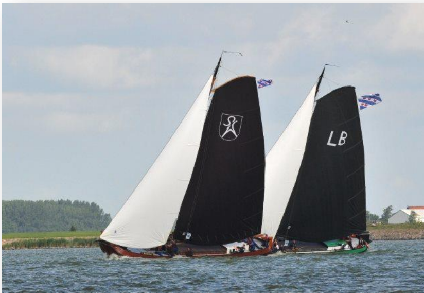
(Kampioen IFKS 2013)

De zwaarste C-klasse sinds jaren. Zo werd het IFKS Kampioenschap 2013 door vele kenners bestempeld. Met enkele oud kampioensschepen als Grutte Pier (kampioen 2010, A-klasse) en Oude Zeug (kampioen 2012, B-klasse) in de gelederen ligt er voor 't Swarte Wief een uitdaging van jewelste. Vastberaden, optimistisch maar ook erg reëel is de stichting begonnen aan dit nieuwe IFKS avontuur.