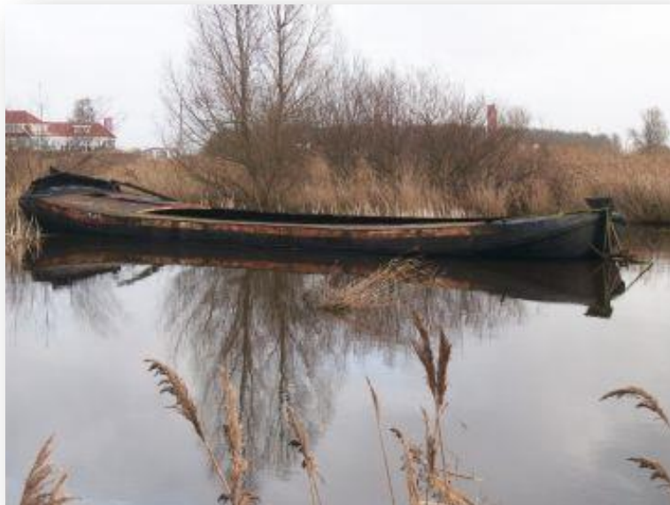
(de Jonge Willem, het nieuwe casco van de stichting sinds voorjaar 2011)

Met het oog op de toekomst en de wens om op lange termijn in de A-Klasse uit te komen heeft de stichting begin 2011 een casco aangekocht. Naast het sportieve aspect is ook de media aandacht bepalend geweest om deze stap te zetten. De A-klasse krijgt zowel radio als televisie aandacht. Dit betekent voor onze stichting automatisch ook meer media belangstelling en dat beschouwen wij richting ons bestaande en toekomstige sponsors als een groot pluspunt.