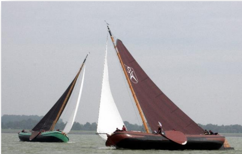
(op weg naar het IFKS Kampioenschap 2011)

De aftrap op het IJsselmeer bij Hylpen leverde, voor het oog van onze sponsorgroep, een prachtige 2 de plaats op, achter de kampioen van vorig seizoen. Ook de wedstrijden in Stavoren en Heeg werden als 2 de afgesloten. De eerste drie wedstrijden werden allen gewonnen door de Hoop op Welvaart uit Sneek van de gebroeders Veenema. De vierde wedstrijd was in Sloten en deze wisten we te winnen, groot feest en we stonden stevig op de 2 de plek in het algemeen klassement. In Echtenerbrug werd er wederom gewonnen en we liepen weer in op de koploper. We gingen geloven in het onmogelijke namelijk kampioen worden.